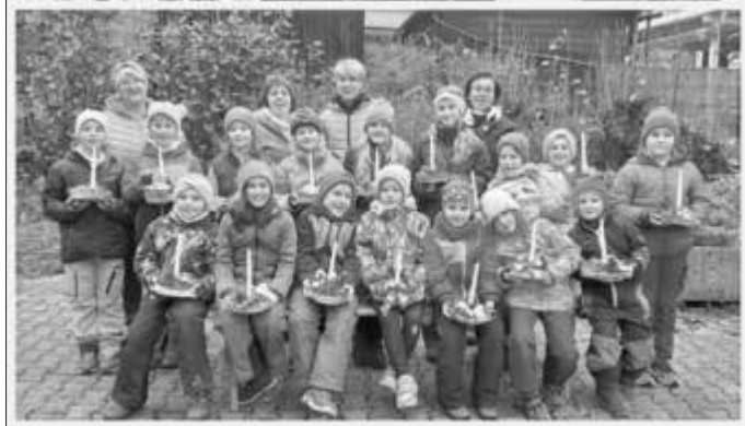
Einstimmung auf die Adventszeit