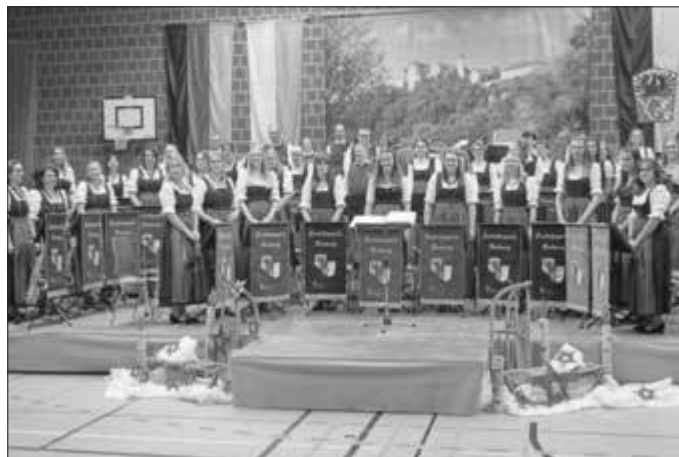
Das Bild zeigt die Musikerinnen und Musiker der Stadtkapelle Harburg e.V.