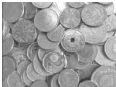
Mit Schlafmünzen die Jugendarbeit von St. Barbara unterstützen

Herzliche Einladung zum Frauenbrunch am Donnerstag, 07. November, um 9.00 Uhr im ev. Gemeindehaus in Harburg. Thema: Zaubervolle Märchenwelt mit der Referentin Frau Dauser. Bitte melden Sie sich bis Dienstag, 05. November, bei Frau Heine an: 09080 967489.