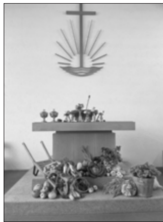
Erntedankaltar der Neuapostolischen Kirche Harburg

Am Sonntag, 6. Oktober 2024 feierten die Christen in ganz Deutschland den Erntedanksonntag. Den Altarschmuck in der Neuapostolischen Kirche übernahmen traditionell die Jugendlichen der Kirchengemeinde.