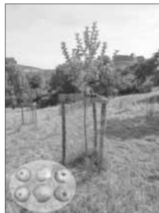
Der „Geflammtte Kardinal“ mit Blick auf die Burg

Extrem selten ist mittlerweile die Apfelsorte „Geflammtter Kardinal“ anzutreffen. Kürzlich hat ein Pomologe einen Altbaum in der Umgebung von Huisheim entdeckt.