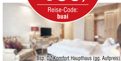
Bsp. DZ Komfort Haupthaus (gg. Aufpreis)