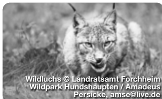
Wildluchs

Die im Städtedreieck Nürnberg, Bamberg und Bayreuth gelegene Fränkische Schweiz steht für gute Luft, gutes Essen und gute Laune – und natürlich für noch vieles mehr. Familien mit Kindern erleben hier einen Urlaub, der ganz individuell an ihre Bedürfnisse angepasst ist. Genießer können sich durch das reichhaltige Bier-, Brand- und Schmankerlangelbott schlemmen. Liebhabern von Aktivurlaub wird in Sachen Wandern, Radeln, Angeln, Kanufahren und Co. allerhand geboten. Kurzum: In der beliebten Tourismusregion findet jeder seinen Traumurlaub. Mit ihren romantischen Tallandschaften, überragt von 35 mittelalterlichen Burgen und Ruinen, ist die Fränkische Schweiz das Urlaubsparadies schlechthin in Deutschland. TreffpunktDeutschland.de/fraenkische-schweiz