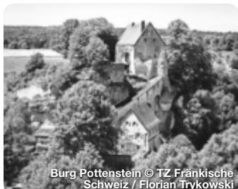
Burg Pottenstein

Alle Termine und Angaben unter Vorbehalt!