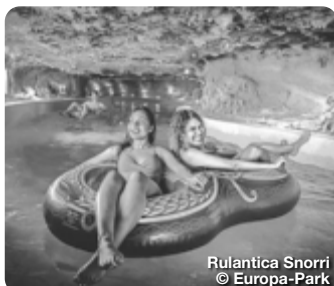
Rulantica Snorri