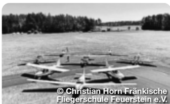
© Christian Horn Fränkische Fliegerschule Feuerstein e.V.

Mitten in der Fränkischen Schweiz spaziert der Nandu umher, grasen das Wisent und norwegische Fjordpferde. Aber auch anderen heimischen Wildtieren und alten Haustierrassen begegnet man im Wildpark Hundshaupten. Hundshaupten 62, Egloffstein