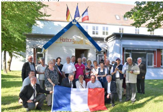
Nach der Schlüsselübergabe vor dem Gouviller Strandhäuschen