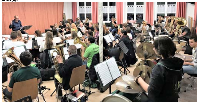
Das Bild zeigt die Musikanten der Stadtkapelle Harburg e.V.