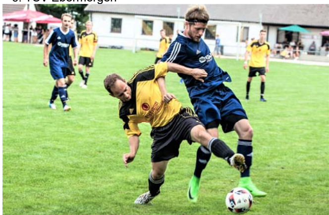
Der TSV Ebermergen (Dunkles Trikot) verlor gegen den SV Mauren (Helles Trikot) nicht nur wie hier den Ball, sondern auch das Spiel um Platz 5 mit 1:0