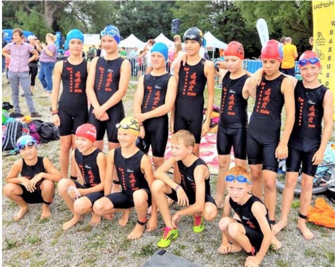
Kuhsee-Triathlon TriaKids TSV Harburg