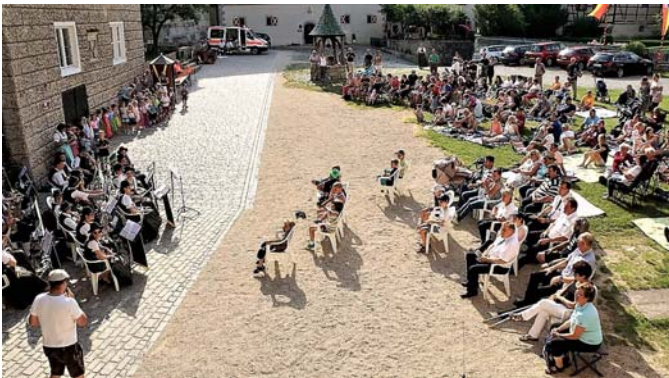
Überblick Kinderkonzert.

Leider fand das Konzert aufgrund eines Regenschauers ein vorzeitiges Ende. Dennoch gab es viel Applaus und die anwesenden Mamas, Papas und Großeltern blickten in stolze Kinderaugen. Ein besonderer Dank galt auch der gemeinnützigen Fürst zu Oettingen-Wallerstein Kulturstiftung für die Unterstützung und Bereitstellung des Burginnenhofes für das Konzert und der BRK Bereitschaft Harburg für die Bereitstellung des Sanitätsdienstes.